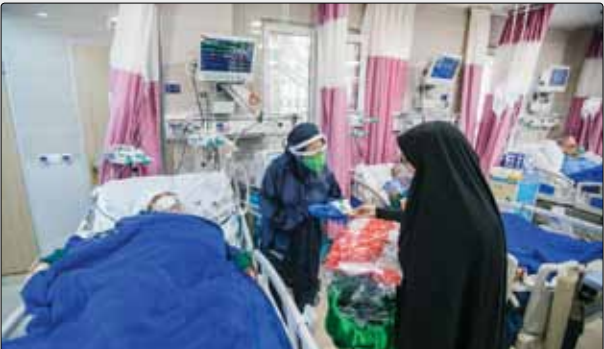
خادمان عتبات عالیات با پرچم متبرک بارگاه امام حسین(ع) در جمع کادر درمان و بیماران کرونایی بیمارستان بوعلی حاضر شدند و با اهدای تیرکی حضرت سیدالشهدا، از زحمات مدافعان سلامت تقدیر کردند. بیماران و پرستاران با اشک و روضه‌خوانی از پرچم امام حسین(ع) استقبال کردند.

طلاب جهادی برای کمک به کادر درمان قم در موج سوم کرونای بیمارستان‌ها شدند