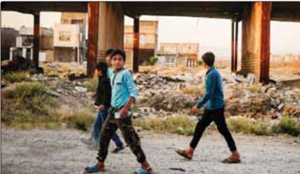
منطقه همت‌آباد از مناطق پرجمعیت و محروم در حاشیه شمال شرقی مشهد است. این منطقه که ۳۵ هزار نفر جمعیت دارد، همچنان در تقسیمات کشوری روستا محسوب شده و از خدمات شهری محروم است. فقر، اعتیاد، نبود آب شرب استاندارد، ندانستن سیستم فاضلاب مناسب، آلودگی‌های محیطی، ساخت‌وسازهای غیرمجاز و غیراستاندارد از جمله مشکلات این منطقه است.