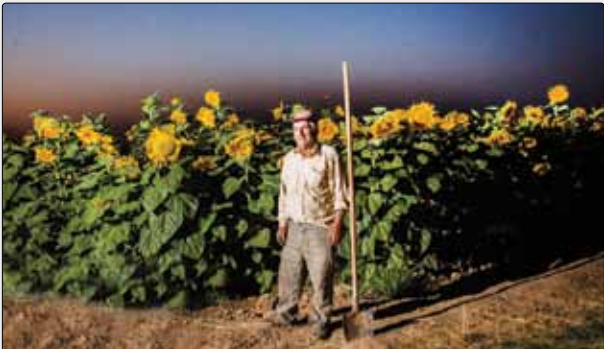
هر ساله از اراضی زیر کشت آفتابگردان در استان قزوین بالغ بر ۲۹۰۰ تن محصول برداشت می‌شود. به گفته مدیر زراعت سازمان جهاد کشاورزی قزوین، حدود ۱۴۰۰ هکتار آفتابگردان آبیاری در سطح استان کشت می‌شود که از این میان بیشترین سهم تولید در شهرستان‌های بوئین‌زهرا و تاکستان به ترتیب با ۱۱۴۰ و ۲۰۰ هکتار است.