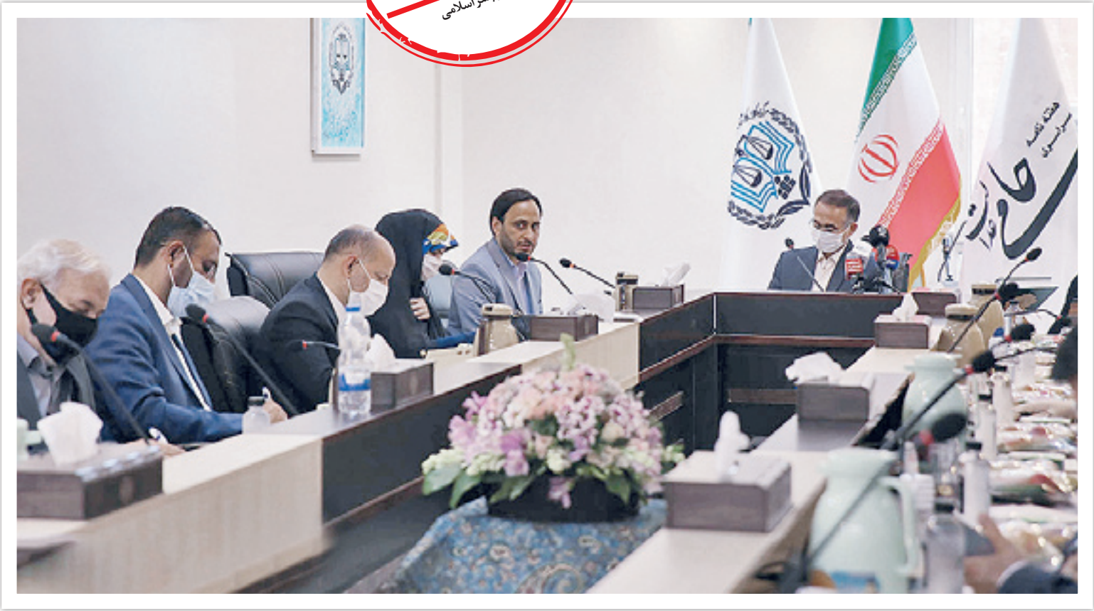
اعضای کمیسیون جهانی حقوق بشر در جلسه روز چهارم