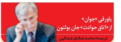
پاورقی «جوان» از «تاق حوادث» جان بولتون ترجمه محمدصادق عبدلهی

یک نماینده اصلاح‌طلب مجلس دهم معتقد است «یکی از اشتباهات استراتژیک شورای عالی اصلاح‌طلبان این بود که برای انتخابات اسفند ۹۸ مجلس لیست نداد. برای اینکه یک جریان سیاسی که به عنوان یک جریان اصلی در عرصه سیاست مطرح است و در چارچوب قانون اساسی کار می‌کند، وقتی لیست نمی‌دهد یعنی اینکه من بنا ندارم که فعالیت سیاسی بکنم و زمین بازی را کاملاً در اختیار رقیب می‌گذارم و غیرمستقیم به مردم پیام تحریم انتخابات و عدم مشارکت می‌دهد». برخی دیگر از اصلاح‌طلبان هم به تئوریک عدم مشارکت همفکران خود در انتخابات پرداختند و این تصمیم را غلط و فاقد مضمی سیاست‌ورزی لازم برای یک حزب سیاسی دانستند. جالب آنکه وقتی برخی رسانه‌های منتقد اصلاح‌طلبان در آستانه انتخابات، عدم مشارکت این جریان در انتخابات را «تحریم انتخابات» و خلاف مردم‌سالاری نامیدند، برخی خواص اصلاح‌طلب آن را رد کردند | صفحه ۲